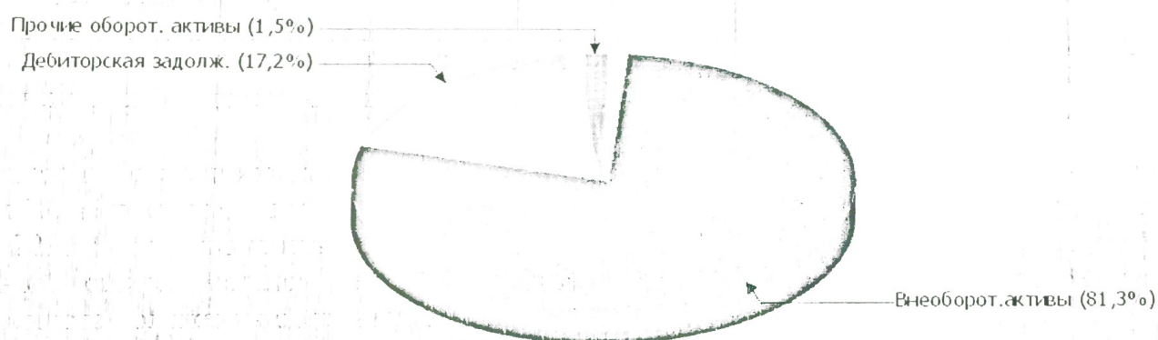
Структура активов организации на 31 декабря 2018 г.

Снижение активов организации связано, в первую очередь, со снижением показателя по строке "основные средства" на 1 094 тыс. руб. (или 99,7% вклада в снижение активов).